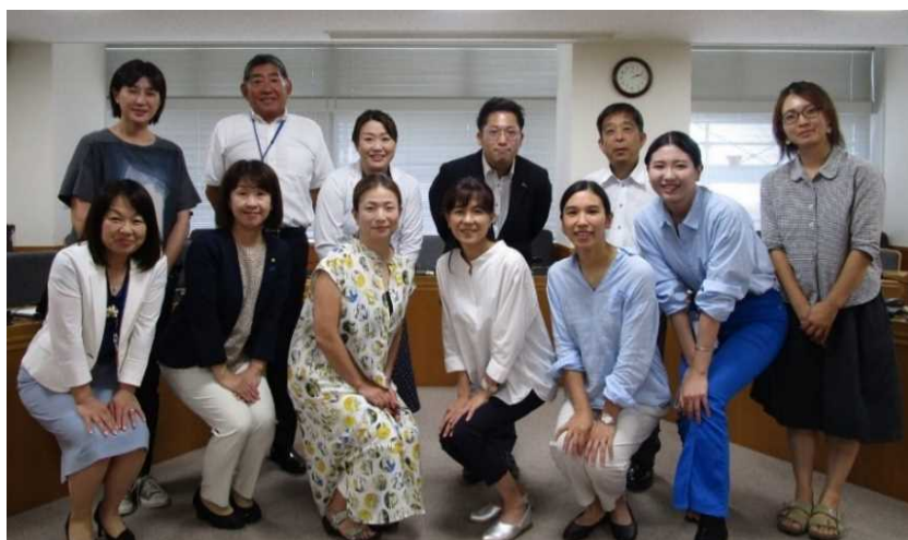
～教育の機会をつなぐ～三つ葉との情報交換会

地区やNPO等、地域の多様な主体と連携し、「まちのとまり木」として、図書館や公民館、児童センター等、様々な場所を活用することで、学校や自宅以外の居場所を拡充すること。「こどもどまんなか応援サポーター」だけでなく、地域全体が見守り役となるよう、市民に広く周知と理解の促進を図ること。