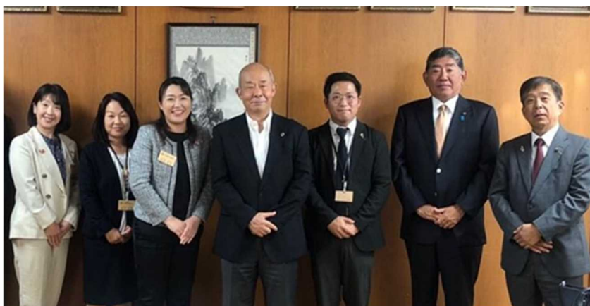
埼玉県戸田市への行政視察

教員が児童生徒と向き合う時間をより確保するため、業務の役割分担・適正化に徹底的に取り組んでいる。本市においても戸田市のように、民間を積極的に活用した業務改善に取り組むとともに、市民に向けて「学校・教師が担う業務に係る3分類」（※注4）について教育委員会と連携して情報発信を行い、周知を図る必要があるのではないか。