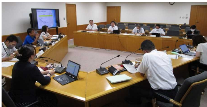
大府市教育委員会との勉強会の様子